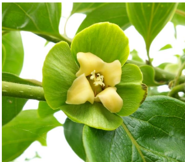
*柿の花が咲きました*