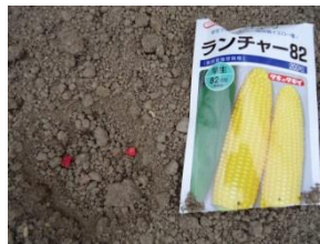
種まきをしました。

https://www.facebook.com/oodeyama2000nenkouen