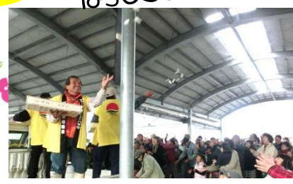
昨年の餅まきの様子